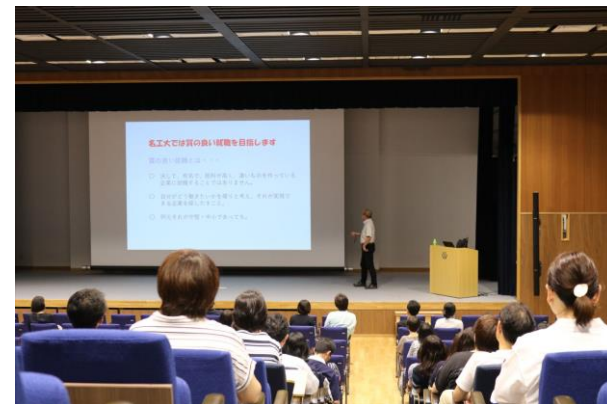
保護者のための講演会