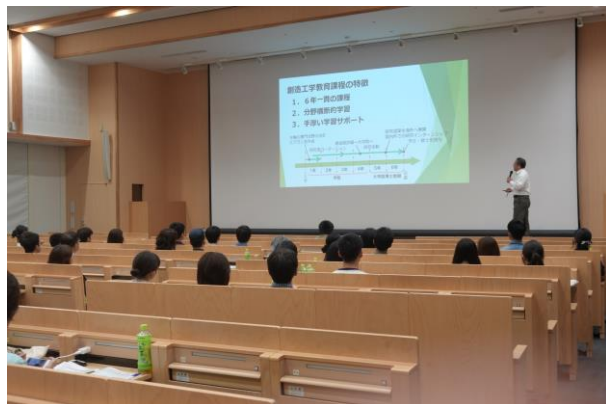
創造工学教育課程説明会